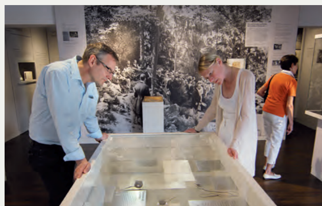
Blick in die Ausstellung. Mehrschichtige Glasvitrine zum Wirken Tschechows.