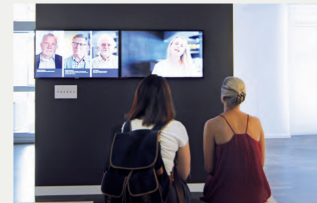
Interviews mit Literaturhistorikern, Theaterregisseuren und -dramaturgen zur Aktualität Tschechows.