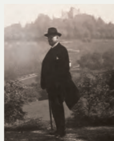
Konstantin Stanislawski in Badenweiler, 1929.

(1859-1916), bedeutender russisch-jüdischer Schriftsteller, der vor allem in Jiddisch, der bis zum Holocaust jüdischen Volkssprache schrieb. Er lebte 1910/1911 in Badenweiler, wo mehrere Werke entstanden. Sein Roman „Tewje, der Milchmann“ war Vorlage für das Musical „Anatevka“.