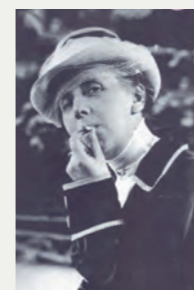
Annette Kolb, um 1910. Deutsche Schriftstellerin und Bürgerin zweier Vaterländer (Deutschland, Frankreich).