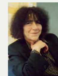
Gabriele Wohmann, Lesung in Badenweiler 2002 zum 70. Geburtstag.