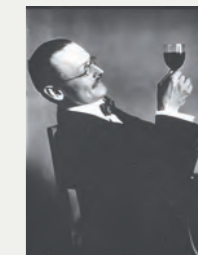
Hermann Hesse, 1910.

Das Heilbad vergibt ihm zu Ehren gemeinsam mit den Universitäten Freiburg i. Br., Basel, Mulhouse und Strasbourg den Crane-Forschungspreis für nordamerikanische Literatur- und Kulturwissenschaften. Und Jawaharlal Nehru (1889-1964), der erste indische Ministerpräsident, weilte 1935 bei seiner erkrankten Gattin Kamala im Kurort und vollendete hier seine Autobiografie.