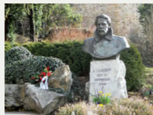
Tschechow- und Perestrojka-Denkmal auf dem Sockel des ersten Denkmals. Geschenk der russischen fernöstlichen Insel Sachalin, 1990.

Der Schriftsteller und Dramatiker Tschechow (1860-1904) ist ein Schwerpunkt der Ausstellung. Sie beschreibt dessen Leben und seinen Tod durch Tuberkulose 1904 in Badenweiler. Eine biografische Zeitachse und viele Exponate informieren zudem über Politik, Geschichte und Kunst seit 1860. Die lebendige Tschechow-Gedenkkultur in Badenweiler und deren Bedeutung für den friedlichen Dialog innerhalb der deutsch-russischen Beziehungen sind weitere Hauptlinien