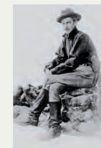
Stephen Crane, 1897 als Kriegskorrespondent in Griechenland.